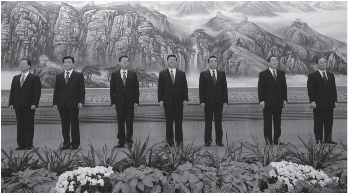
※中國新領導班子明年上台，究竟是一個更為強勢的領導群還是更為弱勢？

剛結束的中共十八大除了是中共領導階層從第四代換代到第五代外，更由於屆齡交棒的關係，十八大前後解放軍領導階層變動幅度之大，也是少見的情況。值得觀察而也可能影響深遠的是：這是胡錦濤在國防治理上的總驗收，驗收的是中共黨指揮槍的政軍關係，驗收的是胡錦濤任內解放軍人事安排的制度化與均衡化。平心而論，這次驗收相當成功，是解放軍在武器裝備等硬體籌獲邁向現代化過程中，於制度與文化等軟體基礎建設上日趨專業化的一次重要奠基。