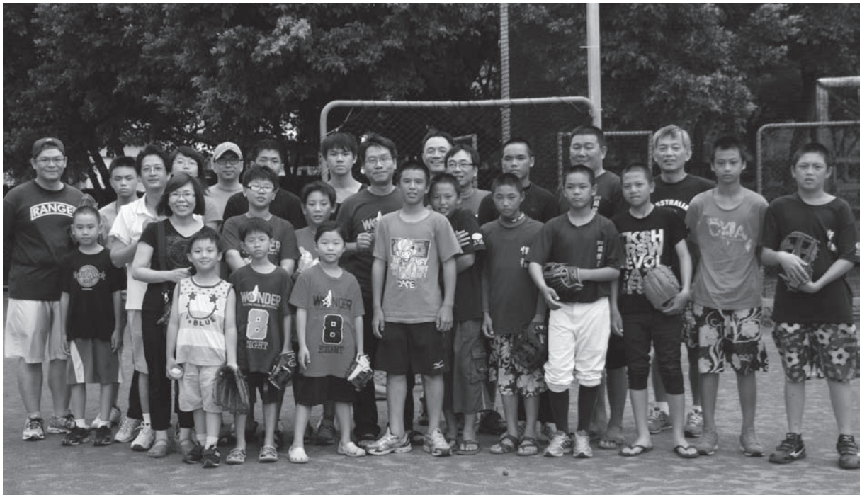
※亂舞社棒球隊、台灣新社會智庫 捐贈瑞德國小棒球用具

2010年夏末，一群「台北客」攜家帶眷來到美麗的東台灣，我們一團三十餘人展開三天兩夜的花蓮之旅。此行主要目的地是瑞穗鄉--秀姑巒溪泛舟、紅葉溫泉泡湯，另外還有一項重要的任務—親子棒球賽。「邊走邊打、邊打邊玩」向來是這群「棒球痞」的慣例，更何況是來到出產眾多棒球好手的花蓮原鄉！