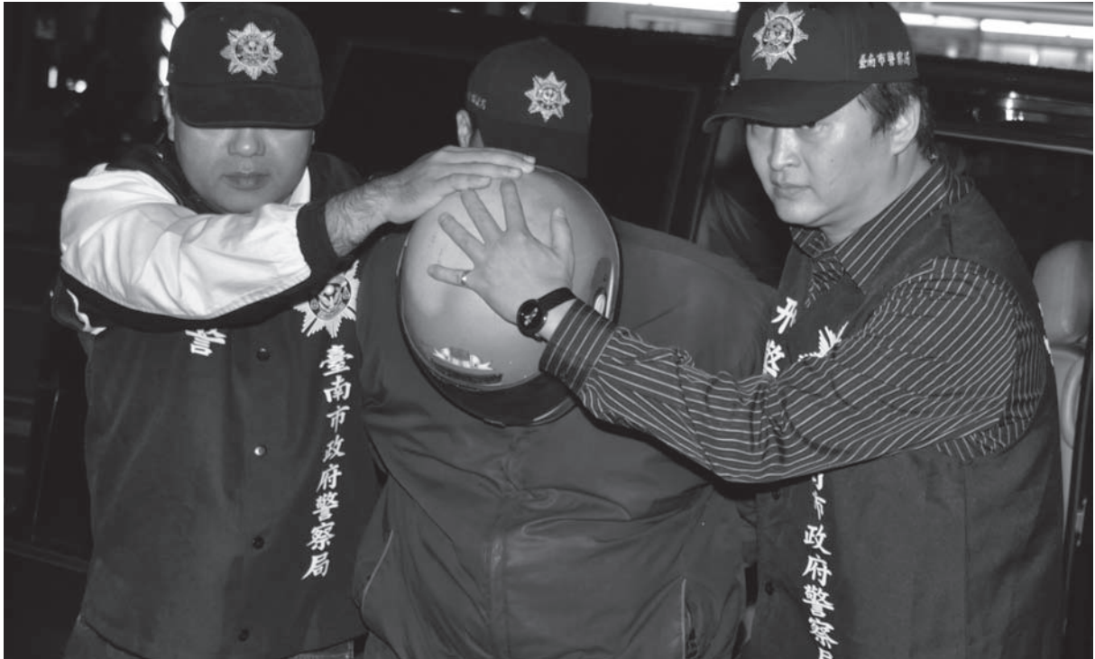
※十歲男童遭無端遭割喉，引發社會震撼跟對廢死的質疑，也凸顯對於對犯罪被害人保護制度的不完善。

在蘇案三人歷經二十一年的纏訟終告無罪定讞的同時，另一個場景，卻是被害人的遺孤在接受媒體訪問時表示：「被害人的人權，蕩然無存；加害人的人權，姦淫司法！」但在宣判被刑求逼供的蘇建和三人「無罪」的同時，我們不禁納悶，到底這件案子中，誰才是加害人？而被害人的人權在哪裡？被害人還能去恨誰？