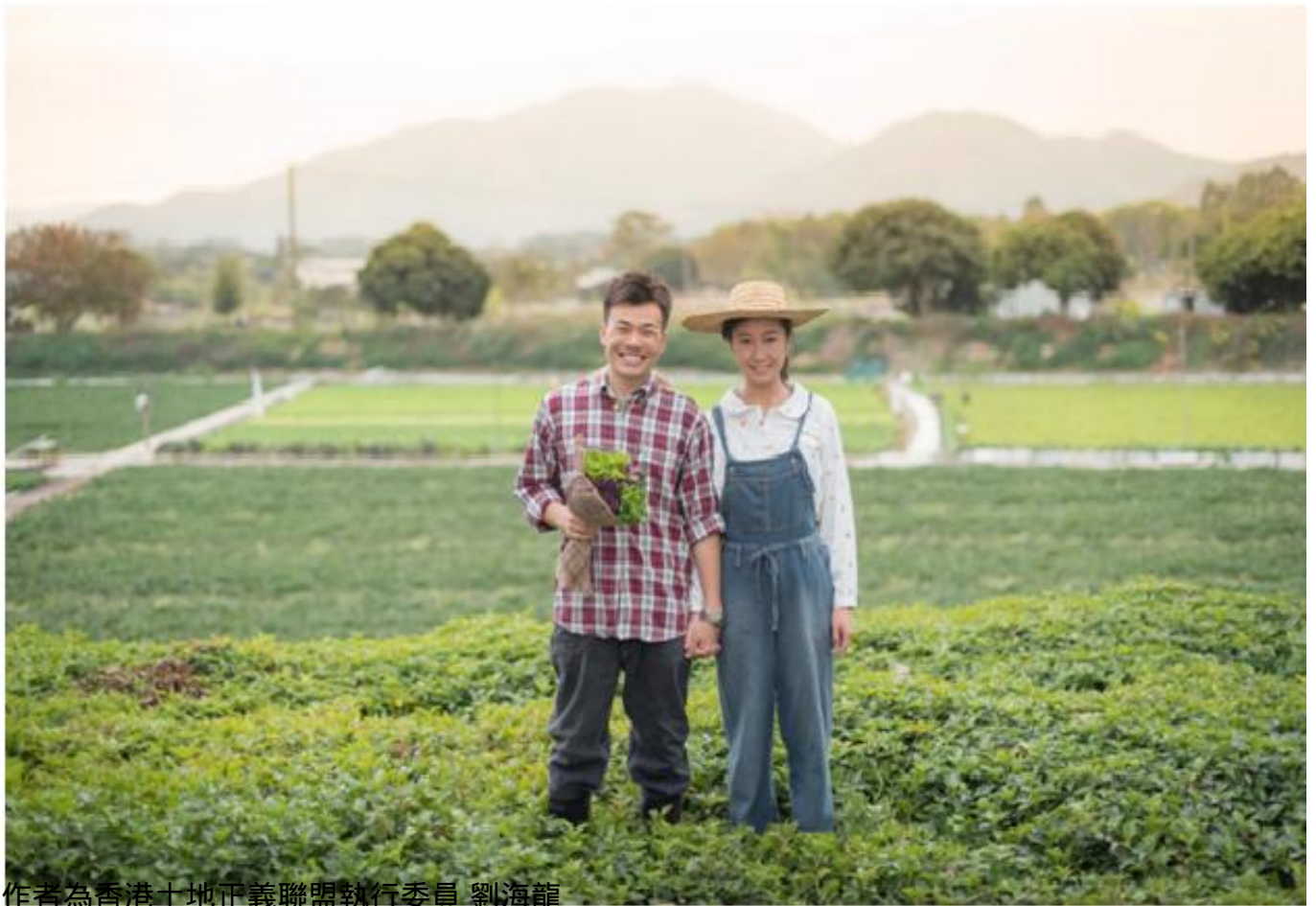
作者為香港土地正義聯盟執行委員 劉海龍