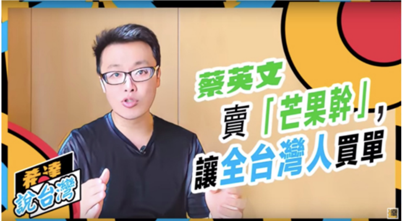
圖1：「玉山腳下」發布的影片標題被發現是由簡體字轉繁體字而露出破綻。