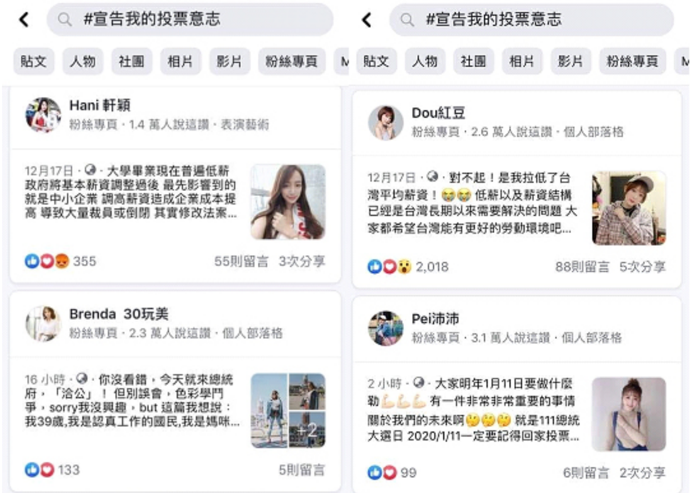
圖3：「#宣告我的投票意志」在臉書上的貼文