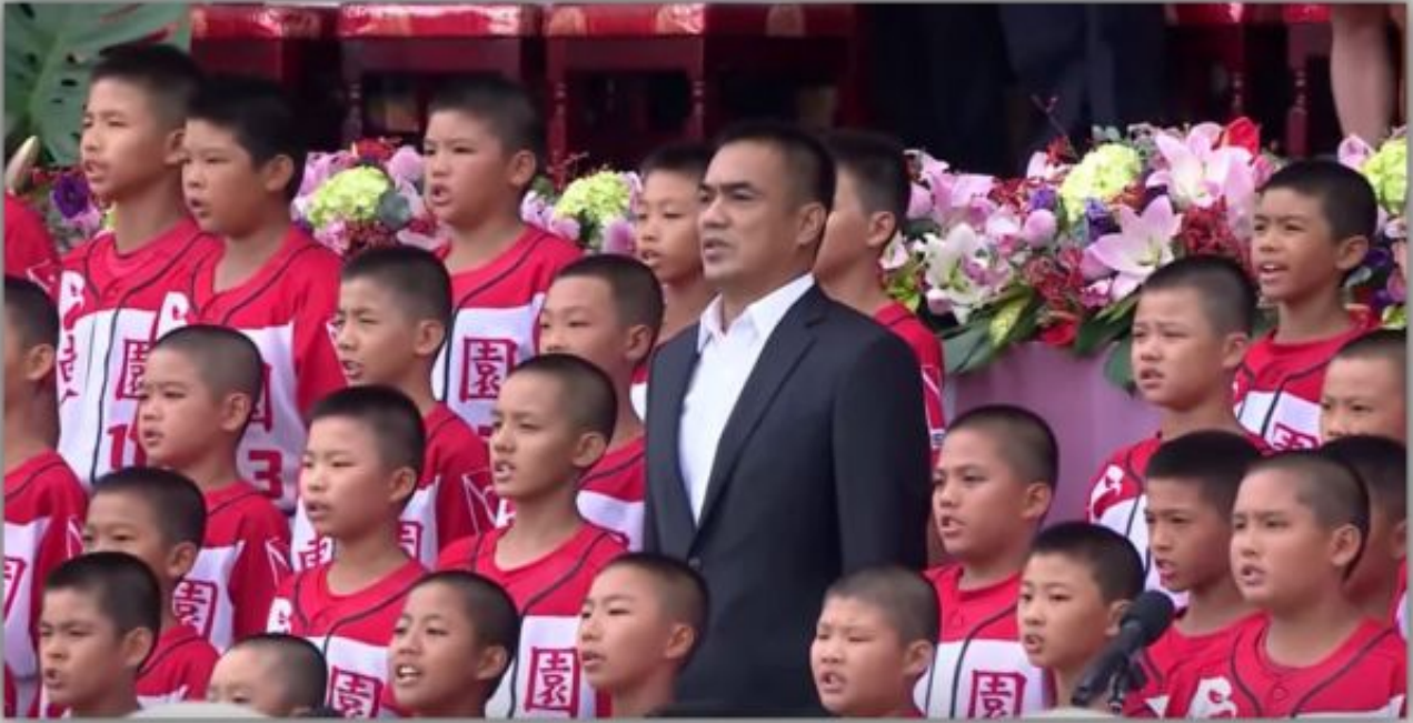
陳金鋒與台北市東園國小棒球隊在國慶大典上合唱國歌。陳金鋒曾是獲得1991年世界少棒（Little League）冠軍台南善化棒球隊的一員，東園國小則是拿到2015年世界少棒（Little League）的亞太區代表權。（圖片取自自總統府影片）

一項運動若依正常發展，年齡由小至大的參與人口數應是由多變少，呈現上窄下寬的金字塔型。台灣各級棒球人口數也隨年齡而遞減，但分布狀態卻不均衡。與其他棒球強國相比，台灣最大的不同是參與這項運動的人數偏低。導致這種現象其實是「惡性循環」下的產物，自政府大力推展棒運以來，打棒球的小孩彷彿是「化外之民」，從小接受斯巴達式的集中營訓練，只重球技不顧課業，實力佳且運氣好的人可以一路「保送」至高中及大學，畢業後打職棒甚至成為旅外的球星，但他們畢竟是少數中的少數，絕大多數遭到棒球淘汰的人，在日後的求學及就業也常被「三振」出局，因而許多家長不願讓小孩加入球隊。