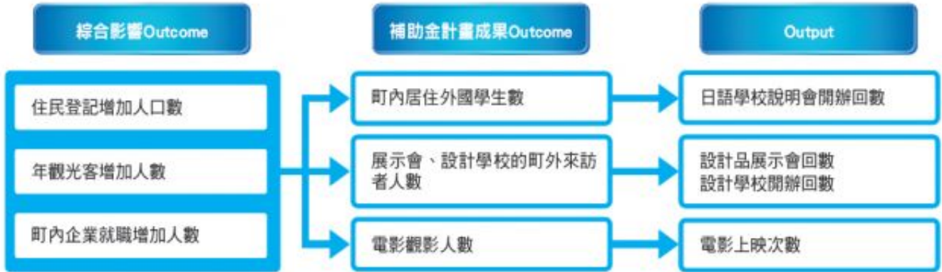
主要的關鍵績效指標 ( KPI, Key Performance Indicator ) 設定邏輯圖：