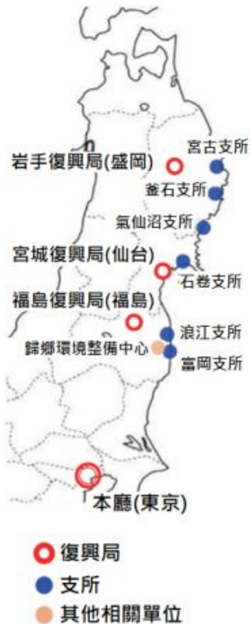
復興廳支局圖復興廳組織圖