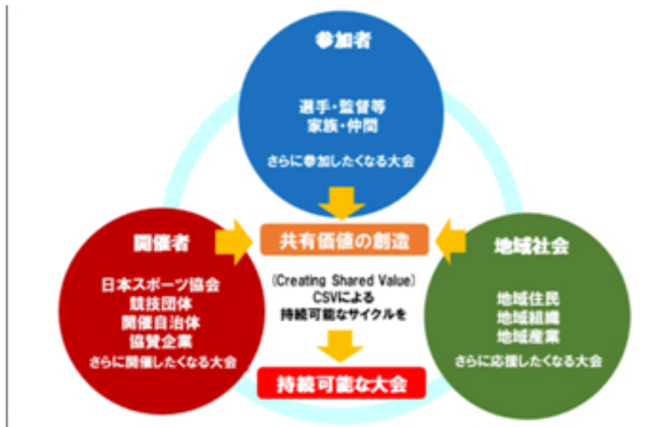
( 圖5：日本スポーツマスターズ戦略プラン https://www.japan-sports.or.jp/masters/tabid193.html )

日本運動大賽是針對壯年世代之間的運動愛好者為了提升競技專業力而舉辦的活動，參加者也限制在 35 歲以上，每年都約有 8000 多人共襄盛舉。與上述定位為希望可以讓全民一起參與運動盛事的國民運動大會有所不同，日本運動大賽是為了提高青壯年世代的運動競爭力，也為已經步入職場後無法像校園時期能遇到志同道合體育社群的朋友創造享受運動的機會。並希望可以藉由該大賽能使參加者、主辦單位（如：地方政府、企業、在地運動俱樂部等等）社區之間的連結更加緊密，使「運動」這項價值能夠永續存在。