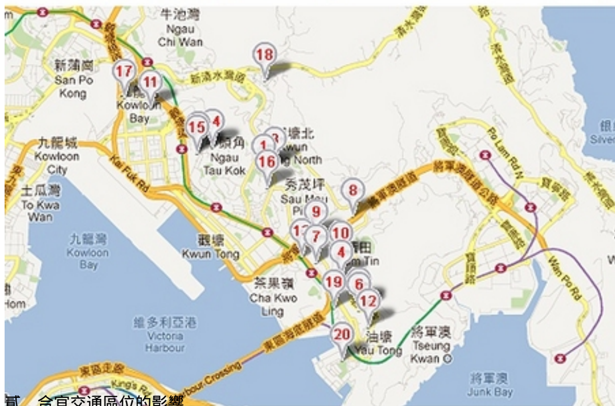
貳、合宜交通區位的影響