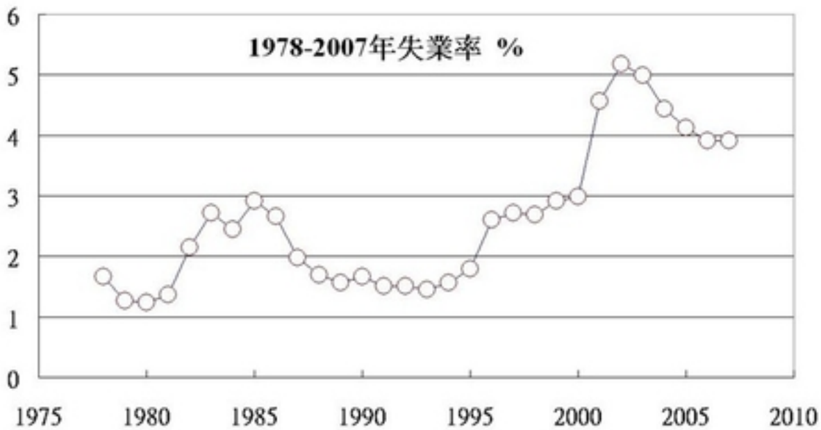
圖三 1978-2007 年的失業率