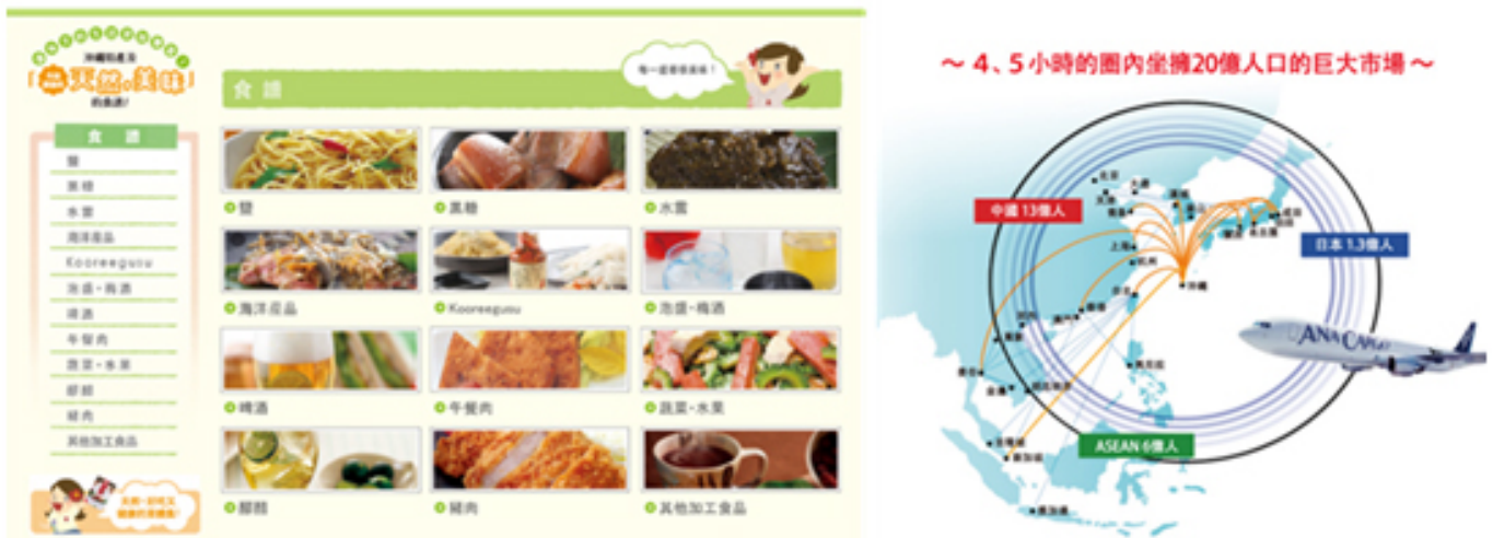
圖二、沖繩縣農食產業鏈與搭配地區發展模式(物流產業鏈)

企業居多，形成一個地域型的農產業聚落。又根據日本經濟產業省工業統計調查顯示，在鹿耳島、北海道及沖繩等食品加工業佔製造業總出貨金額比例分別為56%、34%及35%。若再比對生產型態與地方產業發展路徑，即可發現如沖繩縣，地方政府為了振興地方產業與人口問題，且特別強調飲食文化對於沖繩縣人長壽的重要性，積極展開食品銷售策略，並盤點過後以當地生產的苦瓜、蘆薈、薑黃等植物為原料製造食品銷售縣外，提供當地居民栽培至後端生產加工完整產業鏈(包括後續結合物流產業鏈)，進一步形成特色產業聚落及逐步降低廠商運用進口原料比率等(圖二)，該方法施行多年來，不僅已明顯減緩人口外流趨勢，又透過各類輔助措施，重新點燃產業動能，促進年輕人口回流。