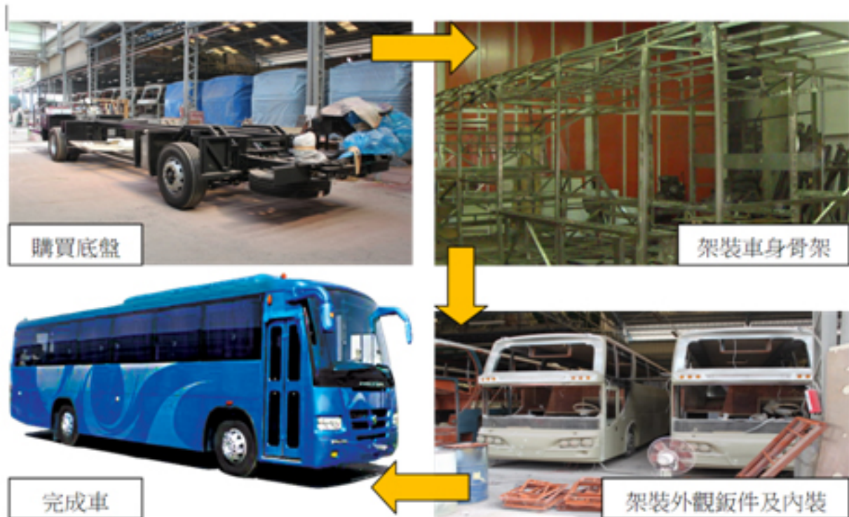
圖2：大客車的生產模式-底盤組裝車體

由於我國車體廠組裝技術與品質精良，也有成功拓展外銷市場的案例，如總盈汽車外銷日本、大吉汽車外銷韓國等。