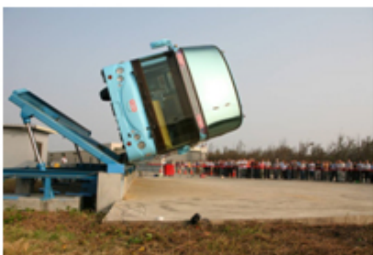
圖4：整車翻覆試驗與電腦輔助工程分析