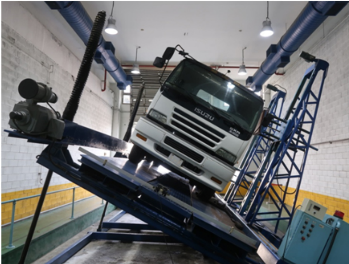
圖3：車輛傾斜穩定度測試

盟針對車高超過3.5公尺的大貨車，應能通過左傾及右傾穩定度大於35度的規定(圖3)，其是模擬車輛在動態行駛或轉彎時的穩定度，以盡可能降低車輛翻覆的風險。