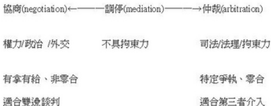
圖5-1 協商 vs. 仲裁 (製圖：洪財隆)