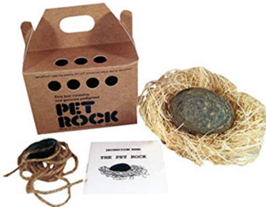
要價9.95美金的 <Pet Rock>（圖五）

」。看似玩笑卻大受歡迎，並且這是只有第一個做的人才會達成有辦法達成的成就，後續的模仿者都難以企及，呼應了前面的「Leader go first.」