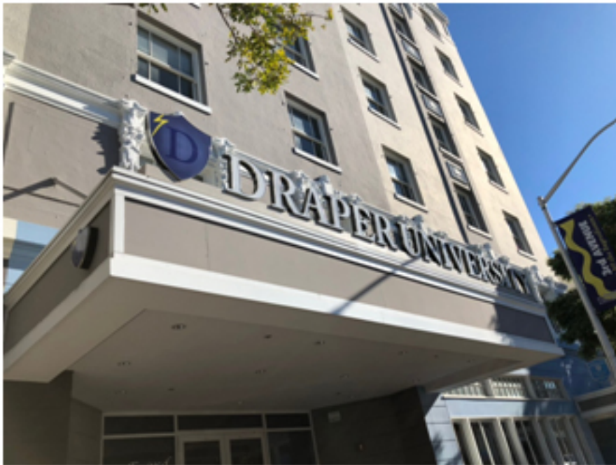
Draper University 外觀 (圖一)

，還有募資簡報的培訓，在台灣也有相當棒且紮實的訓練，除此之外讓我來講述一下這個得天獨厚的環境到底帶給我多少的衝擊。