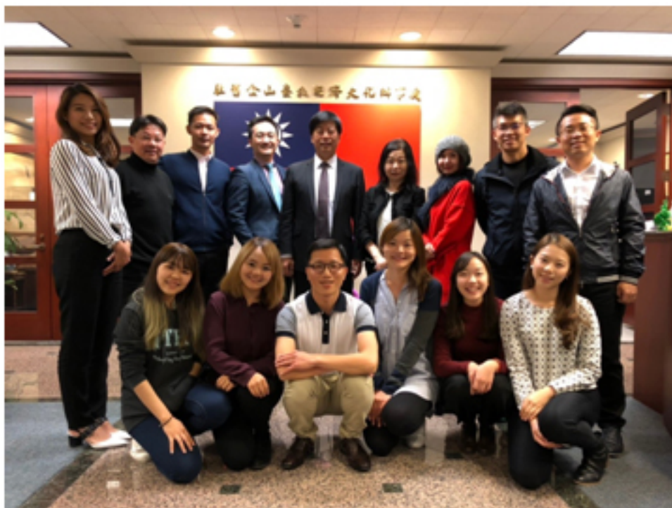
與台灣夥伴在駐舊金山台北經濟文化辦事處與馬處長合影（圖七）