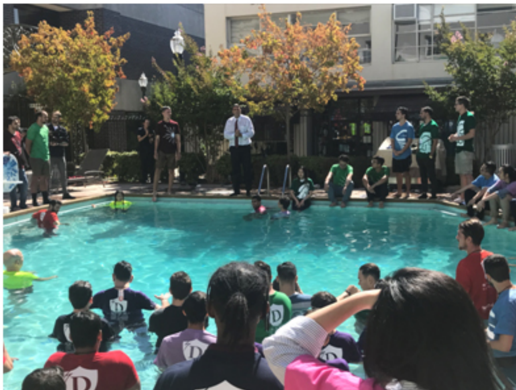
大家入水後聽也濕淋淋的Tim draper分享（圖四）

敢做的事情的人，就是改變世界的人。泳池象徵著未知，而我們應該擁抱未知才能有所突破。」並且也詢問起第一個跳進水裡的巴西人的名字，沒錯，他被記住了！在這裏，勇氣是受推崇的；在這裏，一切是沒有框架的；在這裏，甚至大家還擔心自己不夠特別！