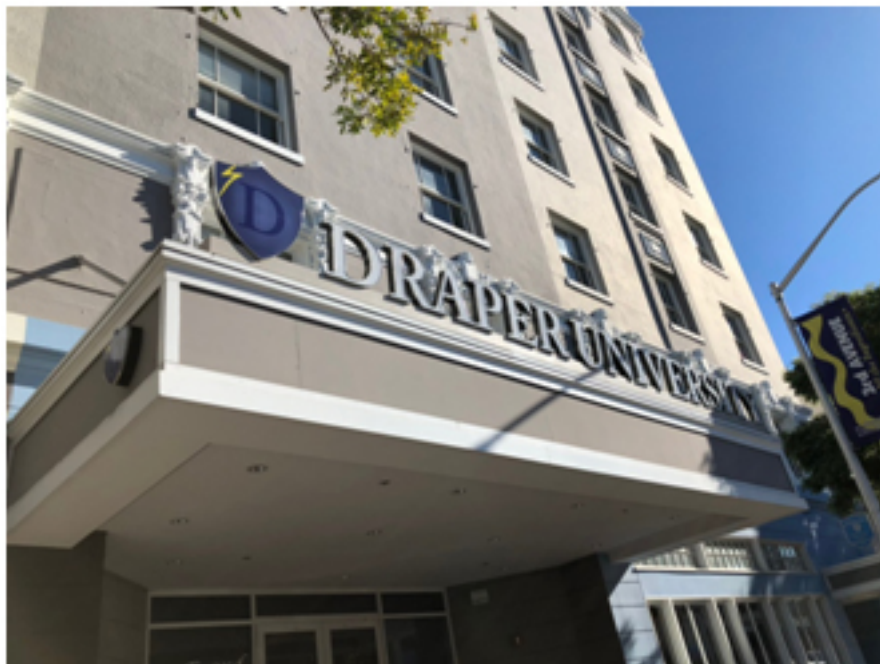
Draper University 外觀 (圖一)

，還有募資簡報的培訓，在台灣也有相當棒且紮實的訓練，除此之外讓我來講述一下這個得天獨厚的環境到底帶給我多少的衝擊。