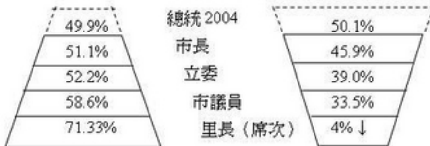
圖一 1998台北市選舉藍綠得票率金字塔結構

200年之後，高層總統、立委、縣市長選舉，政黨競爭色彩愈來愈強化，愈低層則政黨競爭色彩愈來愈淡化，上層，第三黨和無黨人士幾乎全沒空間，里長則國民黨大幅消退，無黨人士大幅增加。