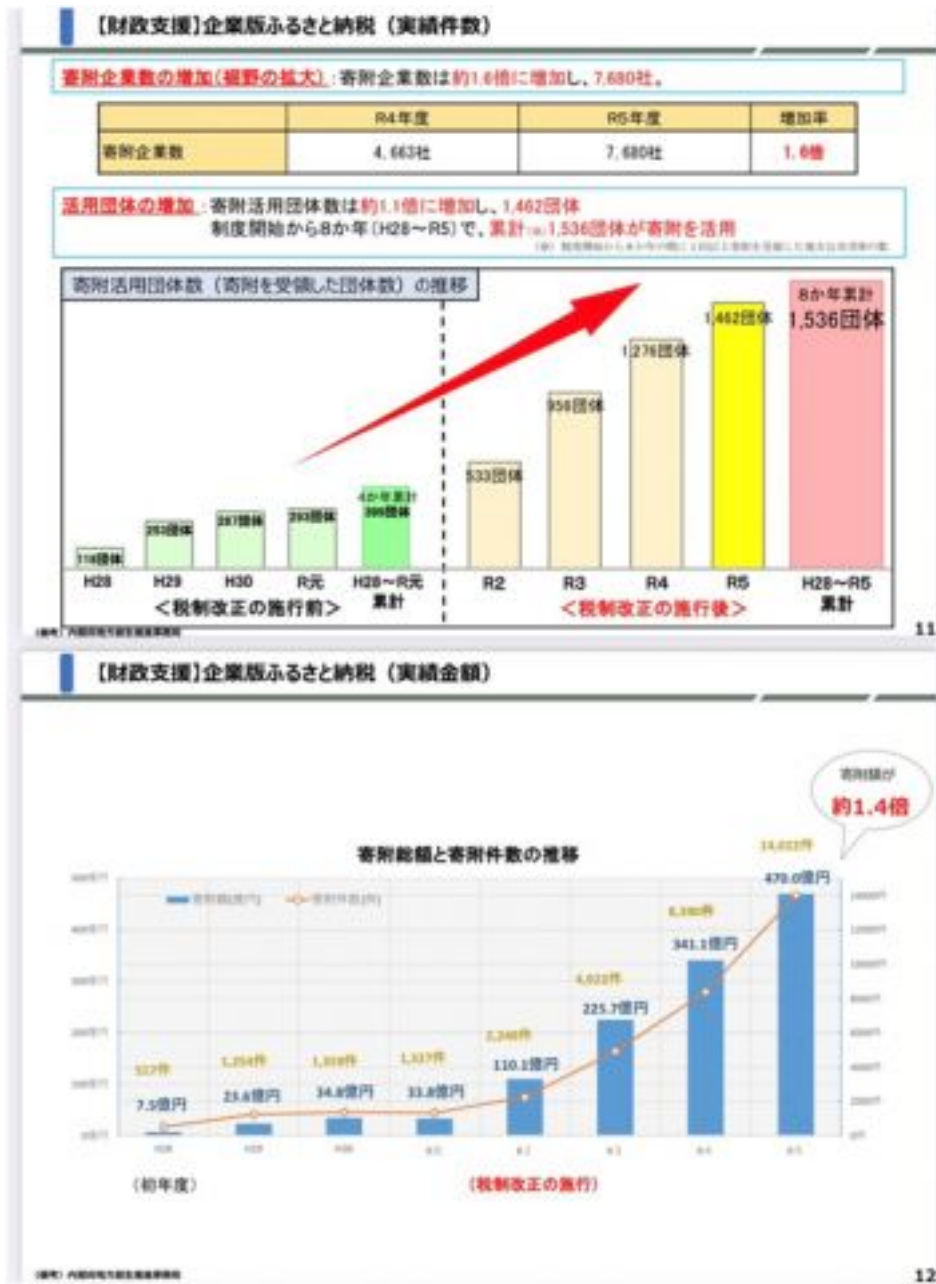
圖：地方創生相關財政資源與企業版故鄉納稅成果。

在人才支援制度上的政績上，地方政府能提出派遣的申請需求，在來由各部會、大學以及民間企業來媒合派遣的專家人才，十年間共派遣支援282位國家公務員、34位學者以及397位專家。而地域振興協力隊從制度創設以來的數據，15年來共有7200名隊員到1164個地方政府去支援，隊員